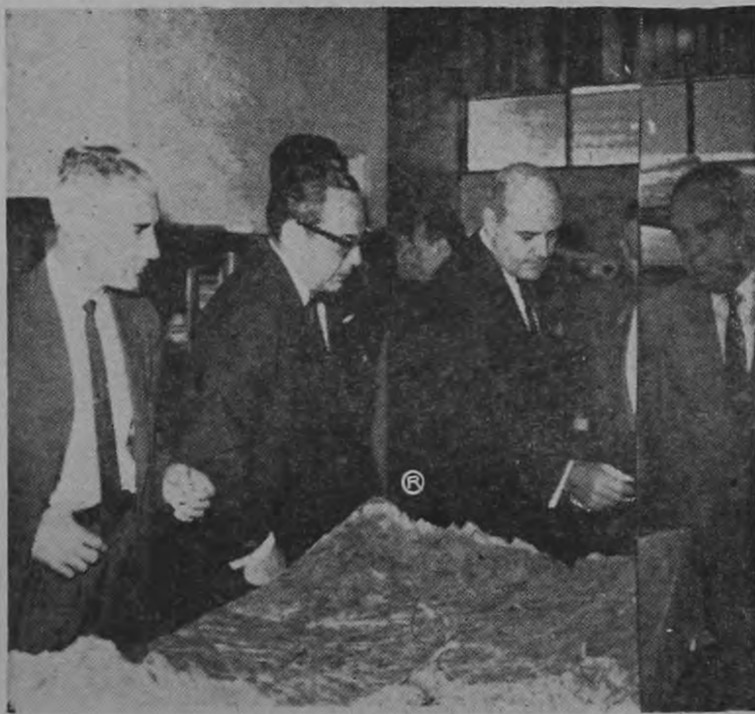
Foto tomada ayer por MEZA en el Servicio Nacional de Acueductos y Alcantarillados cuando el Presidente Echandi, Ministro de Salubridad, el Sub-Contralor Ing. Mario Rodríguez y el Director de los Servicios de Acueductos de Puerto Rico, Enrique Ortega, observan la maqueta del proyecto de abastecimiento de agua potable al área Metropolitana.

Todas estas obras, por un costo total de 9,750.000.00 dólares, se llevarán a cabo con la mayor rapidez posible, contándose con tenerlas completas en tres años a partir de la aprobación del empréstito. Sin embargo, se tratará de construir primero aquellas secciones que puedan venir a aliviar la escasez de agua, aunque como se puede comprender, el problema no estará totalmente resuelto hasta su completa terminación.